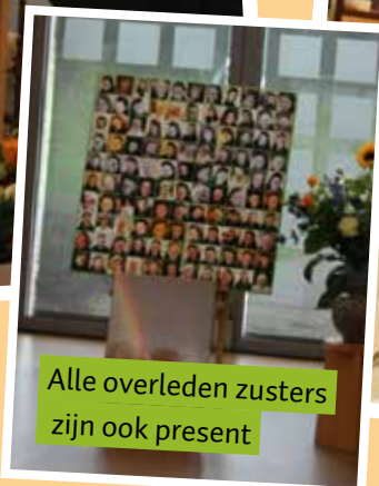
Alle overleden zusters zijn ook present