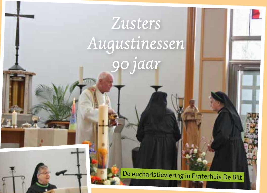
De eucharistieviering in Fraterhuis De Bilt