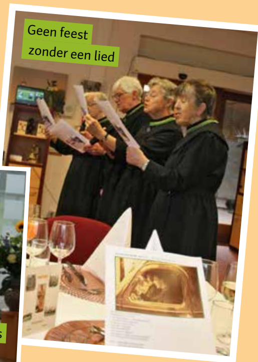
Geen feest zonder een lied